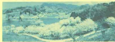
(桜と水仙の名所 佐久間ダム)

赤伏より4km奥に125万トンの佐久間ダムがあります。多目的ダムで周辺が整備されており、特に桜の名所で2月中旬から早咲きの頼朝桜が咲き始め、牡丹桜は4月20日頃まで楽しめます。