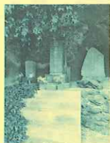
初代醍醐新兵衛の墓所

東京湾最大の島である浮島沖に、太平洋から鯨道(くじらみち)としての深い海溝(東京湾海底谷)があります。鯨南勝山は世界最大の動物である鯨を捕って繁栄していた地です。醍醐新兵衛は3組57隻500人に世襲制の権利を与え、明治初期まで日本では類を見ない220年間、驚異的な組織集団により捕鯨が行われていました。