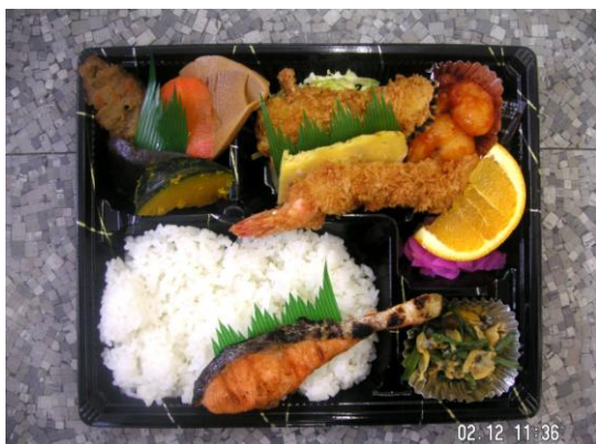
幕の内Aセット 630円 エビフライ・エビチリ・鮭・魚フライ 手作り煮しめなど