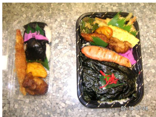
おにぎりセット 350円より おにぎり×2 フライなど のり弁当 450円 鮭・フライなど