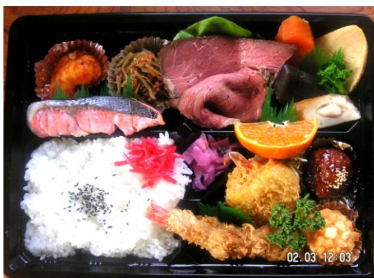
幕の内Cセット 1,050円 ローストビーフ・蟹付きフライ・エビフ ライ・エビチリ・鮭・煮しめ・菜の花の おひたしなど