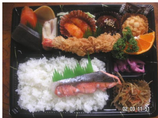
幕の内Bセット 850円 エビフライ(大)・エビチリ・肉団子・ エビかの子・鮭・手作り煮しめなど